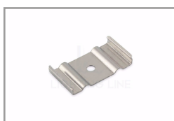
Clip di fissaggio