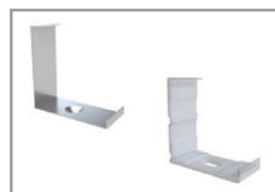
Graffe di montaggio