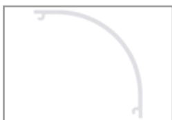
Diffusore opalino tondo

Profilo ad alta dissipazione in alluminio anodizzato argento o verniciato in RAL, ideale per alloggiare al proprio interno strisce LED flessibili. Lo scopo del profilo è quello di dissipare il calore, proteggere e dare un aspetto estetico più gradevole alle strip LED.