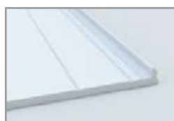
Copertura in alluminio