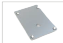
Tappo singolo con foro