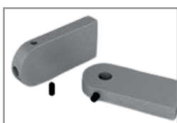
Particolari in alluminio