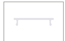
Diffusore PMMA opale