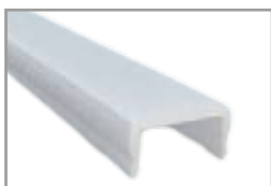
Diffusore PMMA opale 2