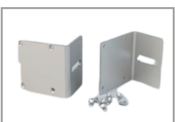
Staffe di fissaggio