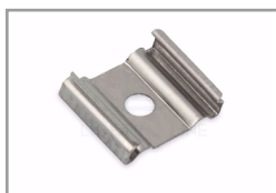
Clip di fissaggio