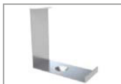
Graffa montaggio di metallo