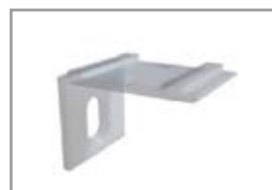
Clip di montaggio 90°