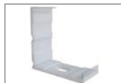
Graffa montaggio di plastica