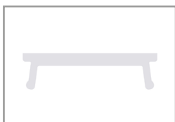
Diffusore PMMA opale

Profilo ad alta dissipazione per cartongesso, in alluminio anodizzato argento o verniciato in RAL, ideale per alloggiare al proprio interno strisce LED flessibili. Lo scopo del profilo è quello di dissipare il calore, proteggere e dare un aspetto estetico più