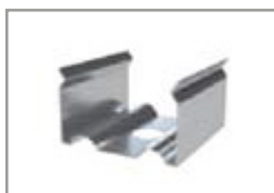
Graffa di montaggio