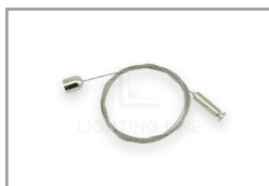
Kit di sospensione 1/2