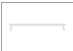
Diffusore trasparente polic.

Profilo ad alta dissipazione in alluminio anodizzato argento o verniciato in RAL, ideale per alloggiare al proprio interno strisce LED flessibili. Lo scopo del profilo è quello di dissipare il calore, proteggere e dare un aspetto estetico più gradevole alle strip LED.