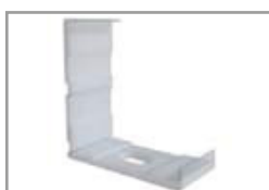
Graffa montaggio plastica