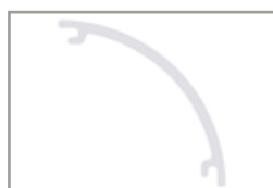
Diffusore opalino tondo

Profilo ad alta dissipazione in alluminio anodizzato argento o verniciato in RAL, ideale per alloggiare al proprio interno strisce LED flessibili. Lo scopo del profilo è quello di dissipare il calore, proteggere e dare un aspetto estetico più gradevole alle strip LED.