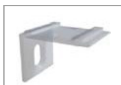
Clip di montaggio 90°