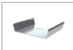
Clip di fissaggio