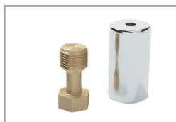
Kit copricavo Argento