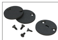
Kit tappi Neri