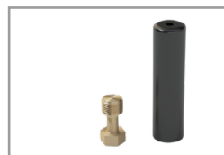
Kit copricavo Nero