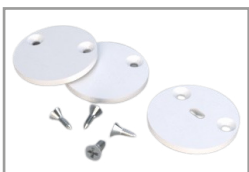
Kit tappi Bianchi