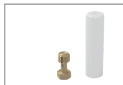
Kit copricavo Bianco