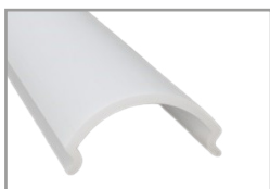
Copertura tonda polic. SBB